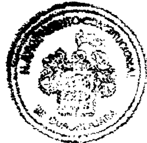
DIRECCION GENERAL DE ADMINISTRACION